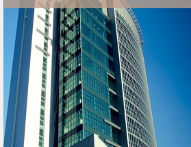
Poznan Financial Center