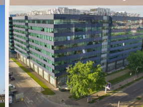
Hermes Business Campus